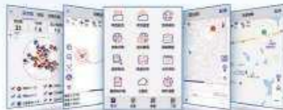
星空图 道路放样 扁平化UI界面 DTM面放样 在线地图